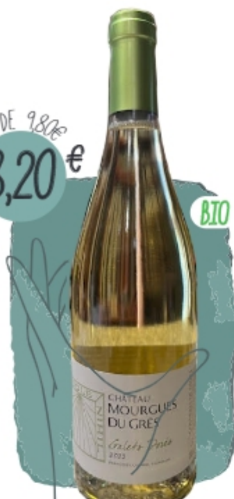
COSTIÈRES DE NÎMES GALETS BLANCS 2023 Domaine Mourgues du Grès RHÔNE SUD