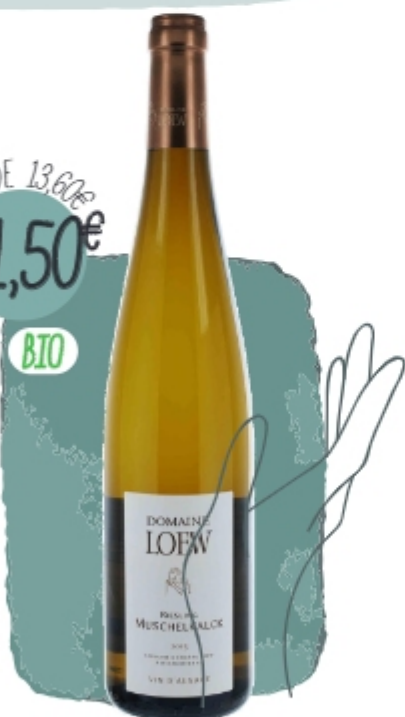
RIESLING MUSCHELKALK 2023 Domaine Loew ALSACE