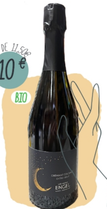
CRÉMANT EXTRA BRUT Domaine Engel ALSACE